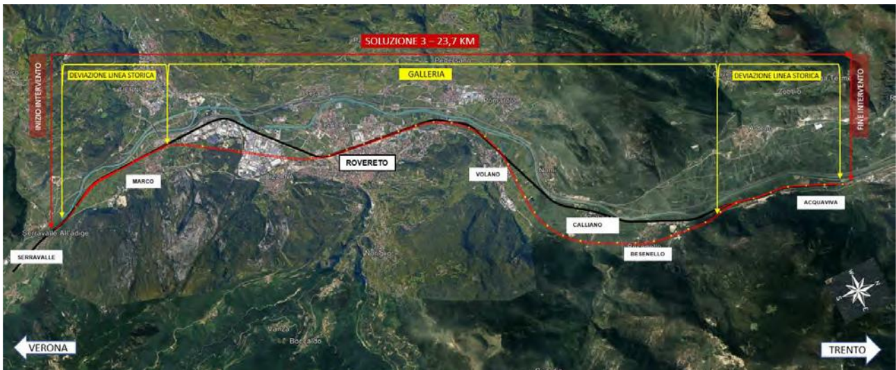
Figura 20-1 - Inquadramento su ortofoto

La soluzione progettuale vede una linea a doppio binario di sviluppo complessivo pari a 23,720 Km, velocità di progetto di 200 km/h, pendenza massima pari a 12 ‰ e raggio minimo planimetrico 700 m.