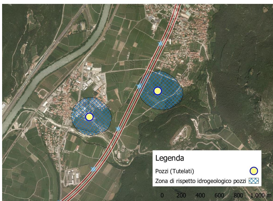
Confronto tra la slide 32 contenuta nel documento allegato all'incontro di Dibattito Pubblico svolto in data 1 aprile 2026 con la reale proiezione del progetto

Sulla scorta dei dati forniti dagli esperti geologi richiamiamo l'attenzione sul fatto che gli acquiferi di conoide del Rio Secco rappresentano le riserve idriche primarie e strategiche del territorio, essenziali per la sicurezza potabile in un contesto di crisi climatica.